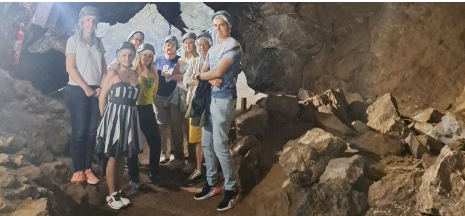
Miembros del Colegio de Administradores de Fincas de Almería durante la visita a la geoda de Pulpí

Almería - Los Administradores del colegio de Almería han visitado el pasado 31 de mayo, la cueva donde se ubica Geoda Gigante en el municipio almeriense de Pulpí disfrutando además de una visita guiada a la Mina Rica, donde se pudo comprobar el enorme esfuerzo realizado para hacer visitable este entorno minero convertido en un reclamo turístico de primer nivel.