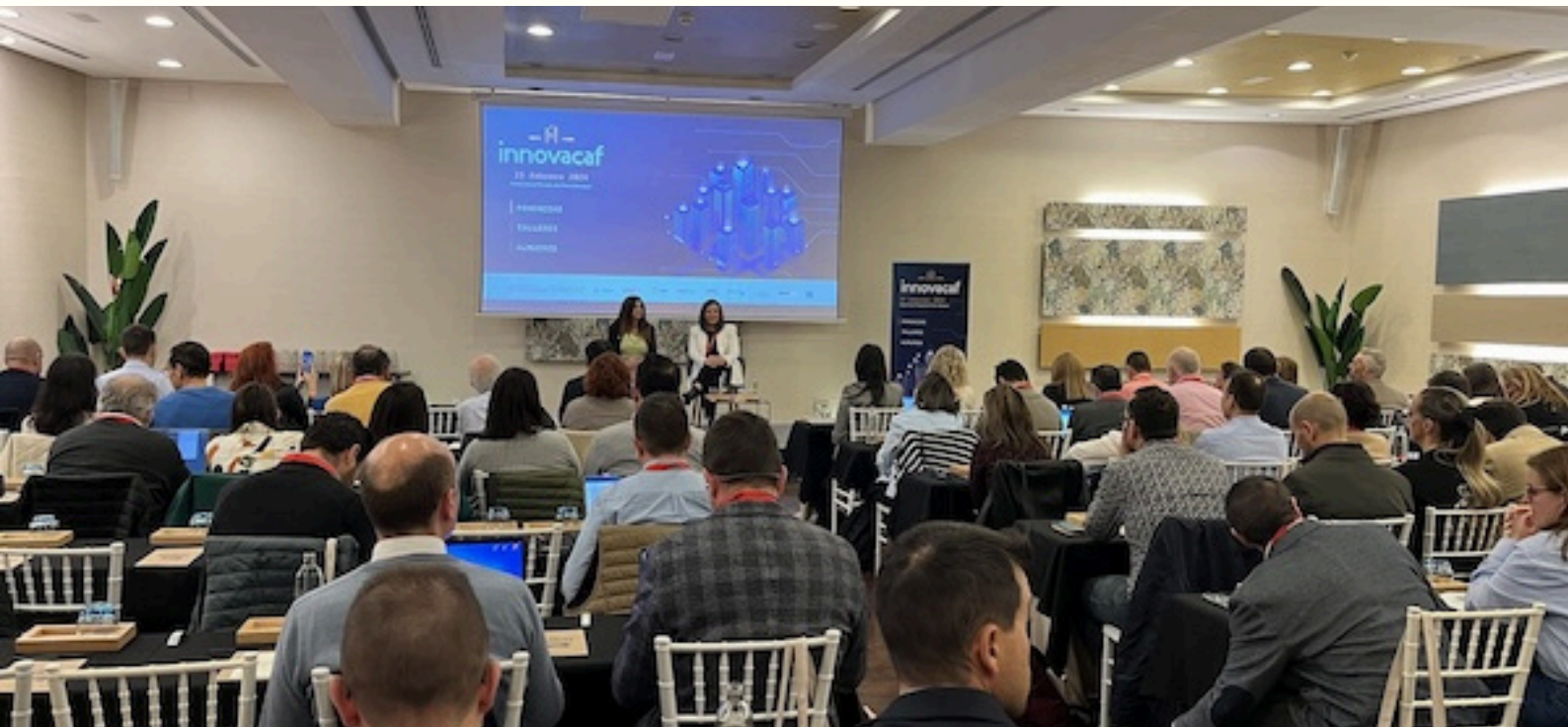
Imágenes de las sesiones de Innovacaf celebradas en Málaga

Málaga- La Facultad de Marketing y Gestión de la Universidad de Málaga será sede de Innovacaf 2025.