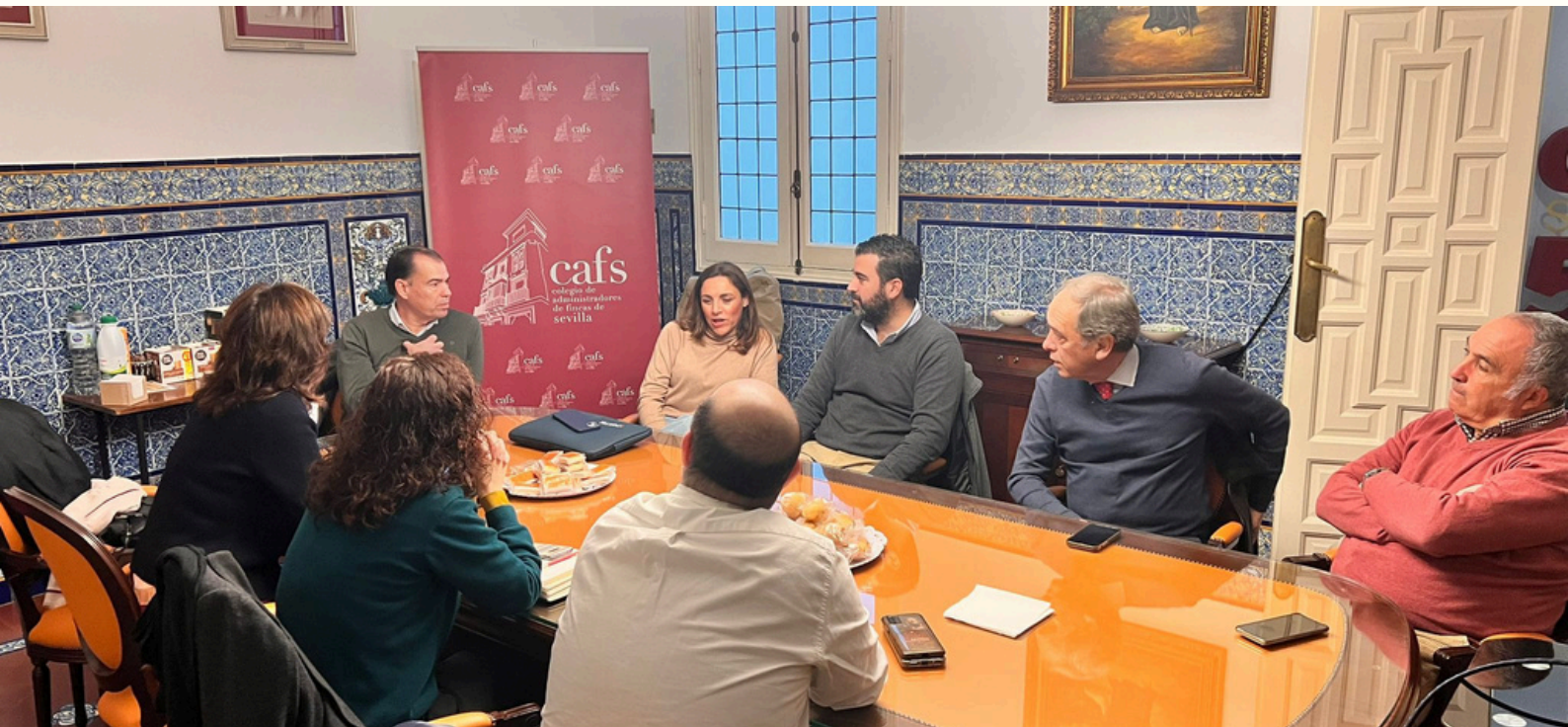
Sesiones celebradas en la sede del Colegio de Administradores de Fincas de Sevilla

Sevilla- El Colegio de Administradores de Fincas de Sevilla sigue trabajando en su misión de garantizar la excelencia profesional y el bienestar en las comunidades de propietarios. En las últimas semanas, se han desarrollado dos iniciativas clave: